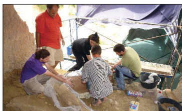
Zientzialari talde bat La Boellako aztarnategian lanean.

TARRAGONAKO LA BOELLA aztarnategiak 800.000 urte dituela baieztatu dute berriki. Mamut arrastoak datatuz lortu zuten arrastoen adina jakitea eta, orain, adituen nazioarteko bilera batean, emaitza egiaztatu dute. La Boellako aztarnategiari esker, hominidoek Afrikatik Eura-