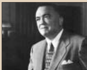
Ezkerrean, FBIko agenteak, bulegoko buruak agindutako janzkeraz. Goian, Edgar Hoover, agindu hura eta beste asko eman zituen gizona.

WASHINGTON, 1908. Uztailaren 26an, AEBetako Justizia Ministerioko buru Charles Bonapartek ordura arteko ohitura eten eta zerbitzu sekretuei konturik eman behar ez zioten agente taldea kontratatu zuen. 34 lagun ziren eta Bureau of Investigation delakoa osatu zuten.