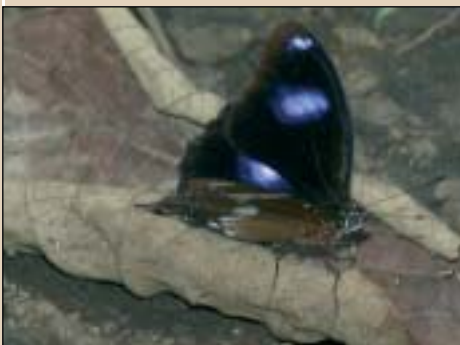
Hypolimnas bolina tximeleta arrek, euren azkena zekarren Wolbachia bakterioari aurre egiteko gai den genea garatu dute urte gutxian.

SAMOAKO IRLETAN oso gertaera bitxia detektatu da tximeleten familian. Savaii eta Upolu irletan 2001ean aipatu tximeleten arrak ia desagertzear izan ziren emeen ugalketa organoetan Wolbachia izeneko bakterioa garatu baitzen. Upolu irlan une batzuetan arrak %1era ere ez ziren ailegatzten,