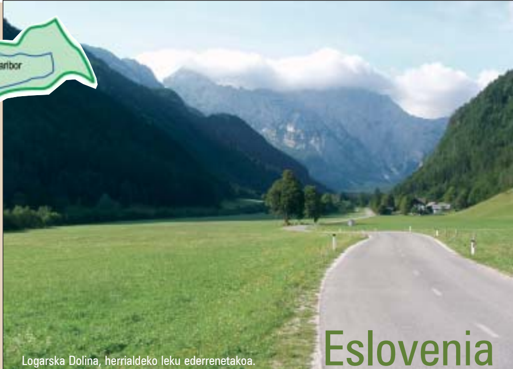
Logarska Dolina, herrialdeko leku ederrenetakoa.