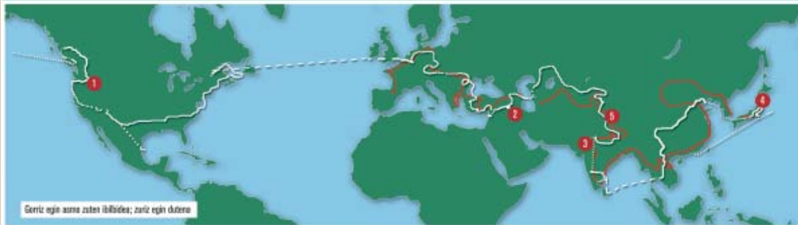
Serriz egin azma zuten ibilbidea; zuriz egin duena