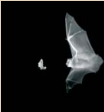
Kamera infragorri eta ultraazkarra erabiliz lortutako irudia.

Ikerlariek esan dutenez, litekeena da beste espezie batzuk ere erabiltzea ultrasoinu imitatze teknika. Eta oraindik frogatu ez duten arren erleek, hontzek, eta sugeek erabiltzen dutela uste dute. ■