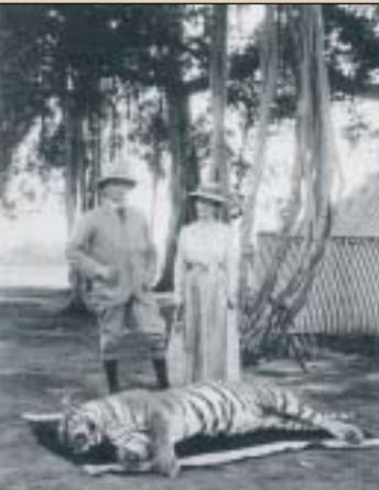
Tigre ehiza ez da atzo goizeko kontua.

5.000 tigre basati baino ez dira geratzen eta datozen urteetan arrisku handi