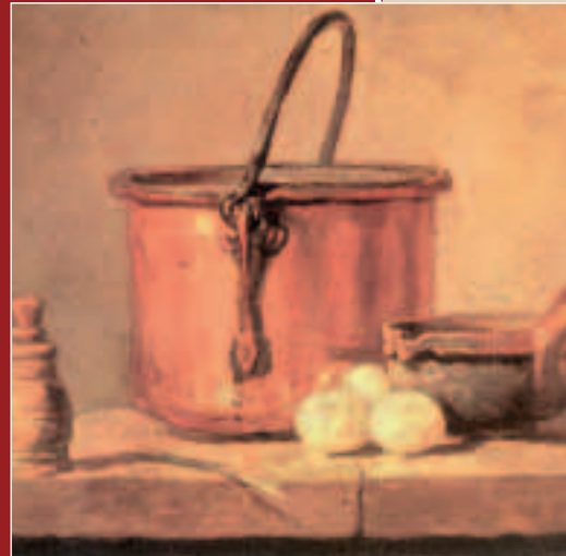
Kobrezko pertzara sartu aurretik izan behar dute mineral horren berri barazkiek eta zerealek.