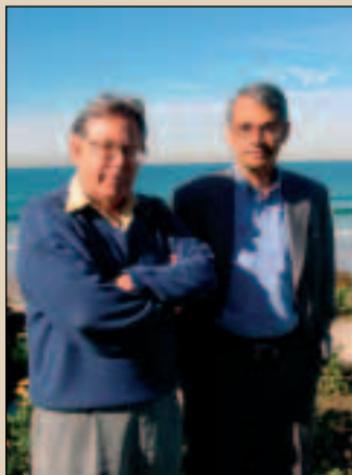
V. Ramanathan ikerlaria (ezkerrean) Paul Crutzen lankidearekin.

Lurraren iluntasuna kontzeptuarekin Lurrak eguzki izpiak islatzeko duen ahalmena neurtu nahi da. Elur eroriberriak eta hainbat hodei motak, esaterako, jasotako izpien erdia